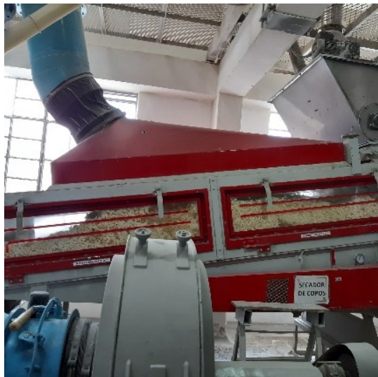
Fotografía 3. Secadora de copos