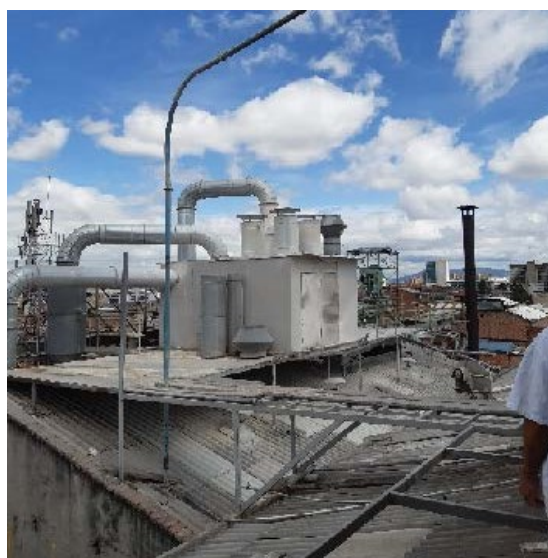
Fotografía 10. Ductos de desfogue