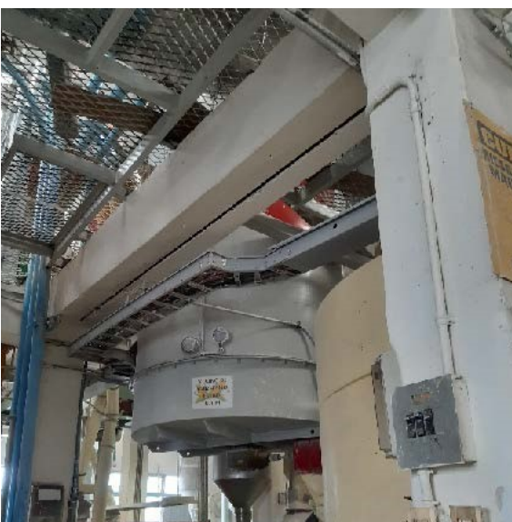
Fotografía 9. Filtro de mangas Ocrim