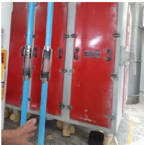
Fotografía 5. Cernedora