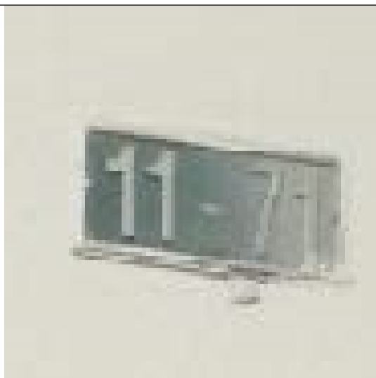
Fotografía 2. Nomenclatura del predio