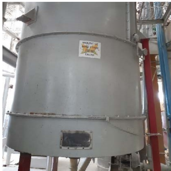
Fotografía 8. Filtro de mangas Favini