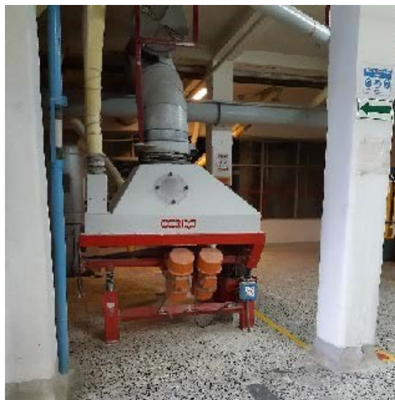
Fotografía 6. Cepilladora