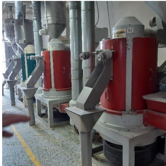
Fotografía 4. Trilladoras