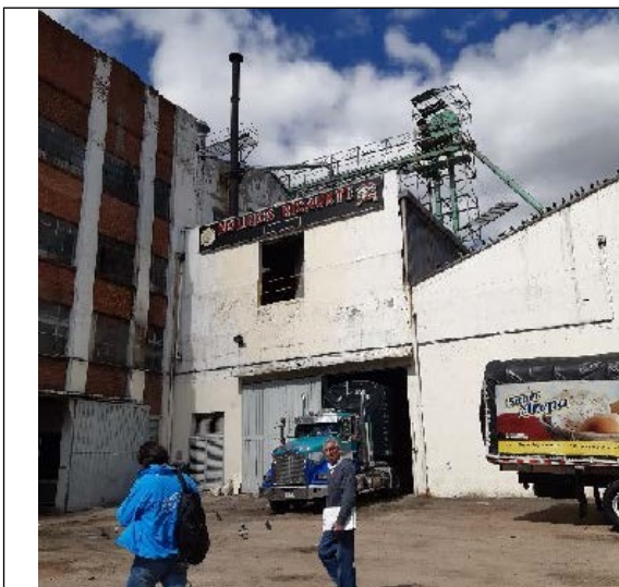
Fotografía 1. Fachada del predio

El registro fotográfico aquí presentado corresponde al tomado en la visita de campo realizada el 16 de diciembre de 2019 y acogida en el concepto técnico 16164 del 17 de diciembre de 2019 y se presentan los equipos relacionados con las fuentes de emisión objeto del permiso de emisiones.