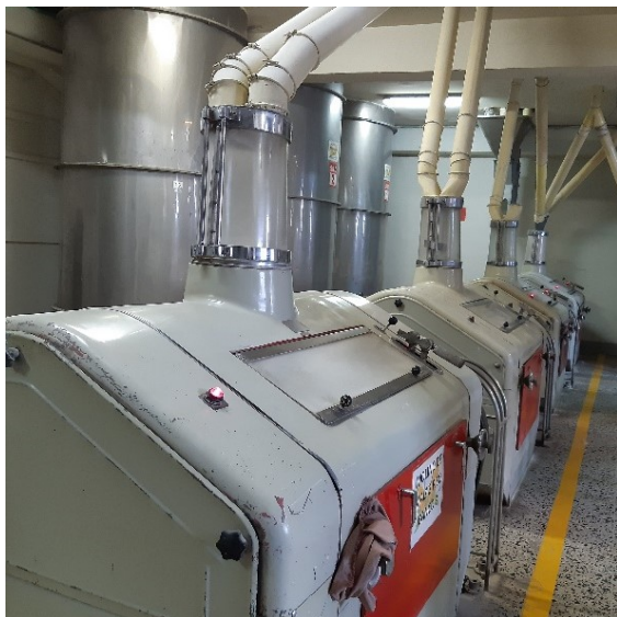
Fotografía 7. Bancos de molienda